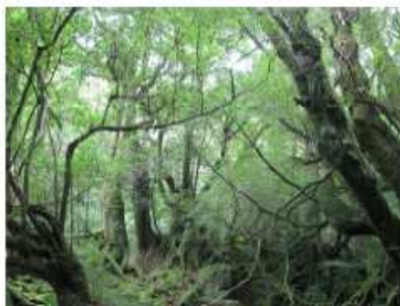
写真 3. 西部地域の照葉樹林

ウミガメ産卵の地として知られる。2005 年にラムサール条約の登録湿地になった。2010 年 8 月 24 日撮影。