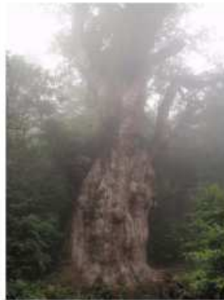
写真 1. 縄文杉

屋久島では、1990 年代後半よりエコツアーガイドの増加が目立つようになり、2004 年 9 月に鹿児島