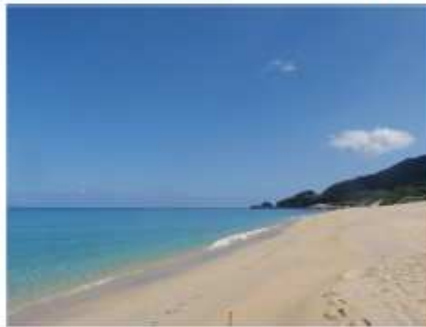
写真 2. 永田浜

ピーク時には 1 日千人を超える観光客が訪れる。2010 年 8 月 20 日撮影。